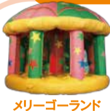
メリーゴーランド